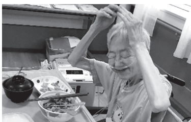
▲美味しくて満面の笑みで思わず〇