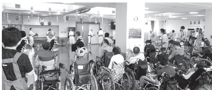
▲新得音頭保存会の皆様が来園