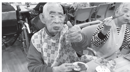
▲「お味は？」と聞かれ、このポーズ!