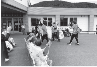
▲待ちわびたゴールの瞬間、皆さん拍手でお出迎え！

今年はその十勝エリアのゴールがこの新得やすらぎ荘正面玄関との事で9月26日、利用者の方々と一緒にゴールで待っていました。