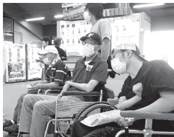
▲オッズを見て予想