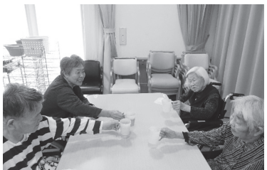
▲お食事前に乾杯しました!