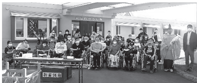
▲無病息災を願って記念撮影