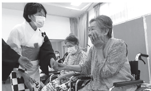
▲踊りを観覧した後、握手してもらいました！