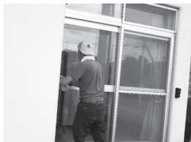
▲細かいところまで丁寧に綺麗に