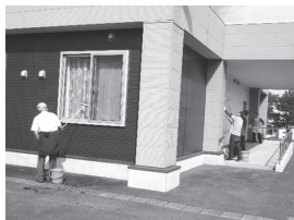
▲高いところも道具を使ってピカピカに