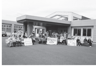
▲最後は皆で、はいチーズ！