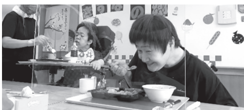
▲まつり食、おいしい！