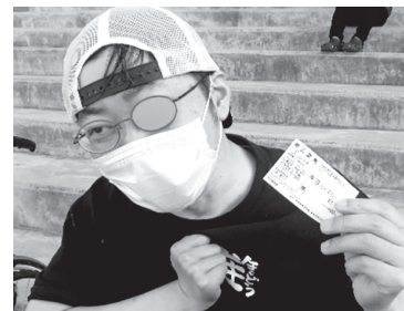
▲結果は見事の中。やったね！