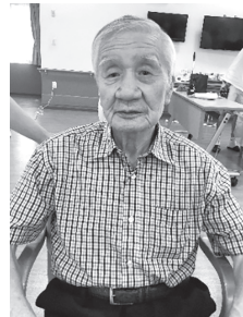
▲髪も綺麗に整うと、お出かけしたくなるね!