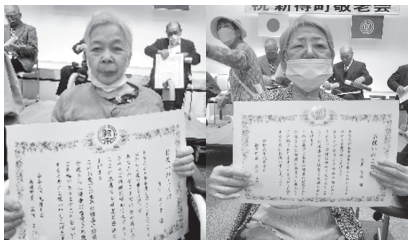
▲表彰を受け、少し緊張気味

新得町敬老会で表彰を受けられた2名の利用者さん、ひまわり荘敬老会でお祝いを受けられた5名の利用者さん共にこれからも元気に生活してほしいと思います。