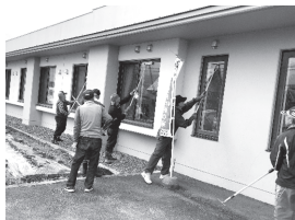
▲大勢で来てくれました