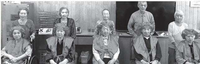
▲仲の良い利用者に赤いちゃんちゃんこを着せてもらい、記念撮影