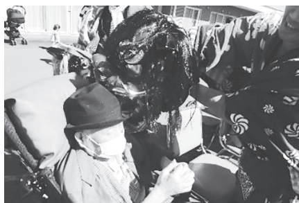
▲獅子舞の厄除けでご利益GET！