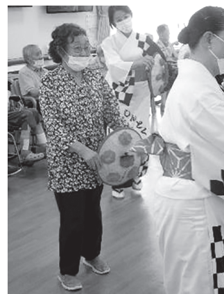
▲新得音頭の方に混じり、素敵な踊りを披露