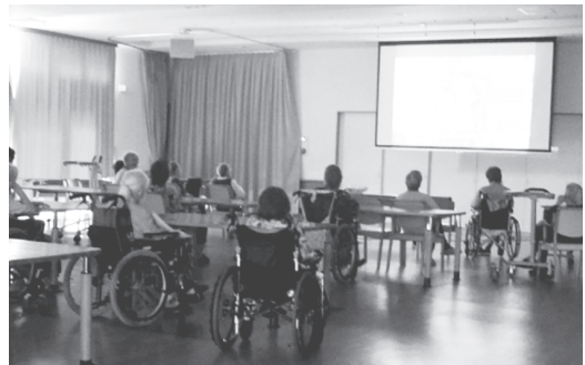
▲スクリーンに引き込まれるみなさんの姿

8月下旬の午後、当施設の食堂にて、2日間にわたる納涼映画会を開催しました。今回の上映作品は、2011年公開の日本映画『天国からのエール』と、2023年公開の『ザ・スーパーマリオブラザーズ・ムービー』の2本です。会場を暗くしてスクリーンに映像を映し出し、まるで映画館にいるかのような雰囲気味わっていただきました。今回は20名以上の利用者の方々にご参加いただき、スクリーンに映る映像にじっと見入ったり、面白い場面に笑顔を見せるなどして楽しまれました。映画終了後には、「面白かった！」と職員に声をかけてくれたり、利用者さん同士で感想を語り合う様子も見られ、夏の暑さを忘れてリフレッシュする良い機会となりました。