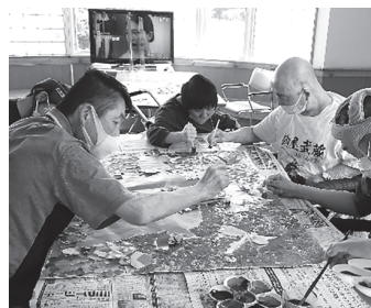
▲皆さんで協力して作製しました