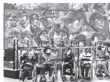
▲歴代日本ハムOBと一緒に