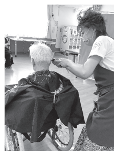
▲バリカンを入れてもらって短くスッカリ!