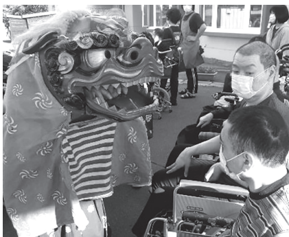
▲屈足神社の御神輿と獅子舞が来園