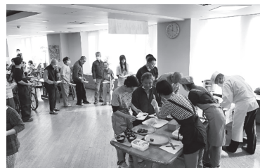
▲お寿司のおかわりに長蛇の列が!!