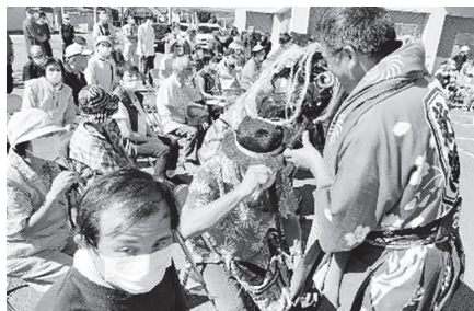
▲これで1年間無病息災