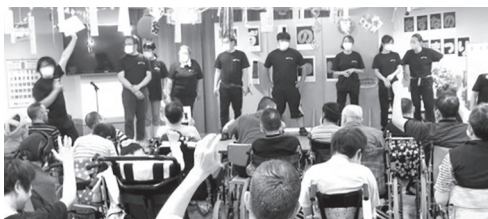
▲職員余興で大盛り上がり！