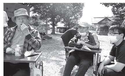
▲屈足神社でまつり食を堪能