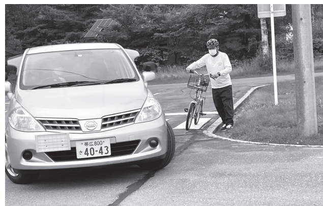
▲おっと危ない！ 後ろからクルマが…