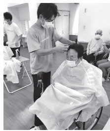
▲ダンディによろしく!