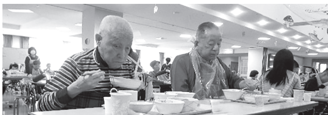
▲秋の味覚を堪能しました