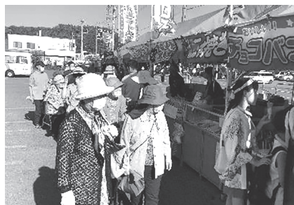
▲最高のお祭り日和♪