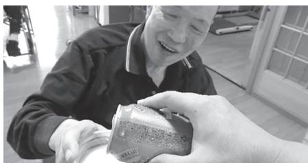
▲もう一杯いただきます!