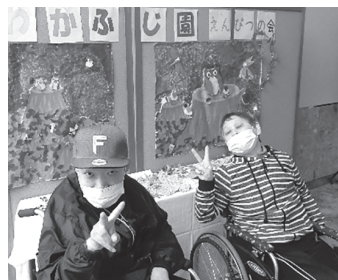
▲会場で作品をバックにピース!