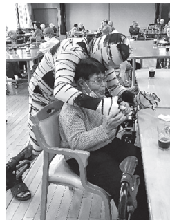
▲イタズラしちゃうよ(笑)

職員がミイラ男、魔女、海賊、キョンシー等に仮装し、利用者はお菓子を食べながら、仮装した職員を見て、「おもしろいね」「ミイラ男は誰が入っているの」等と話し、楽しいひと時を過ごしました。