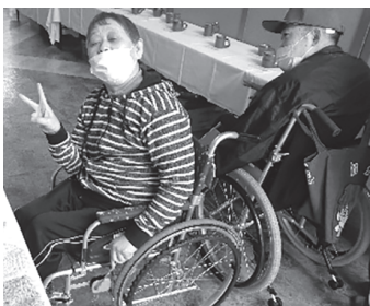
▲編み物も作りました